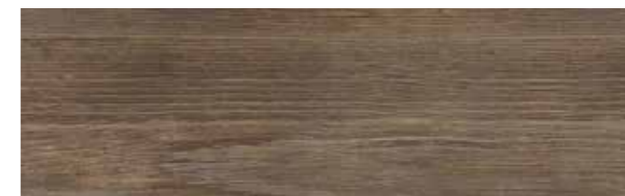
Bodenfliese Finwood braun | Floor Tile Finwood brown 18,5x60