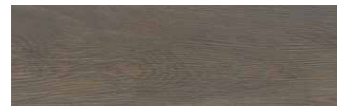
Bodenfliese Finwood wenge | Floor Tile Finwood wenge 18,5x60